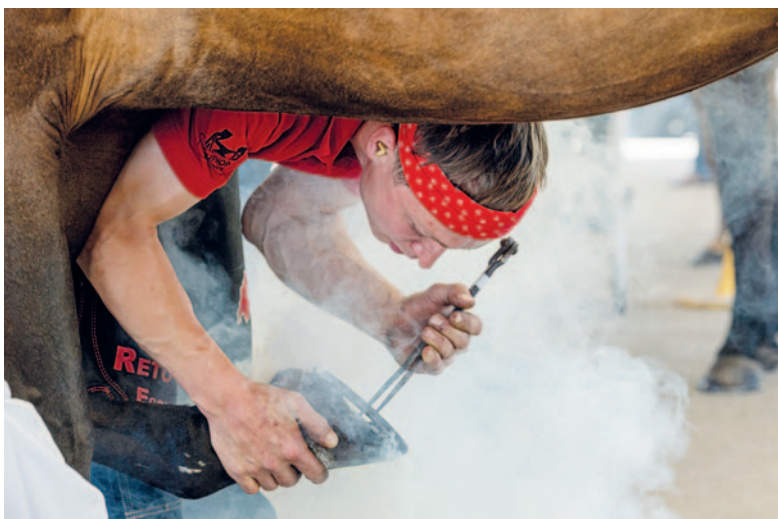
Erste Anprobe am Huf des Pferdes.

Was ist denn die grösste Herausforderung im Wettkampf selbst? «Man muss an alles denken. Es gibt so viele Dinge, die man trainiert. Man nimmt sich etwas vor, sieht dann aber bei einem Konkurrenten, wie 'anders' er es macht. Dadurch darf man sich aber nicht beeinflussen lassen und muss bei seinem Plan bleiben. Am Schluss wird es nicht besser, als man es zu Hause geübt