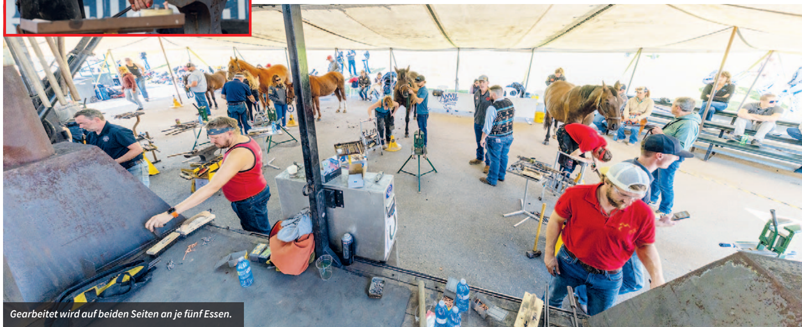
Gearbeitet wird auf beiden Seiten an je fünf Essen.