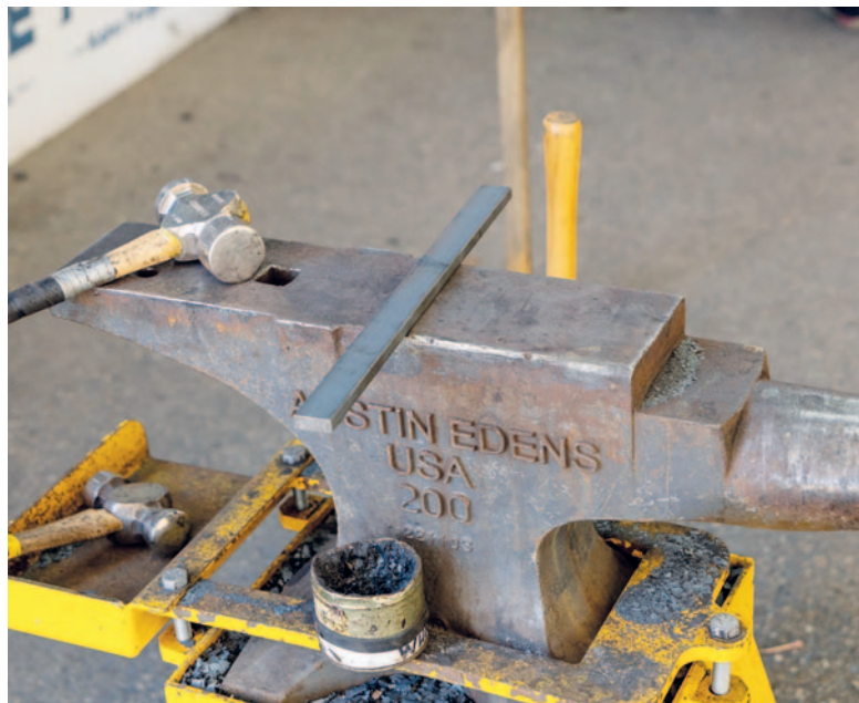
Als Ausgangsmaterial gibt es lediglich ein einfaches Stück Stahl.

einem Pferd aufgenagelt werden», so Meier. Ausserdem seien die Aufgaben bereits seit mehr als einem halben Jahr bekannt, so konnte zu Hause ausgiebig geübt werden – was auch getan