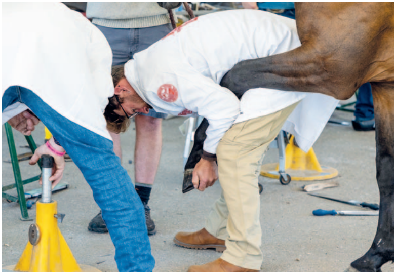
Die Richter beachten jedes noch so kleine Detail.